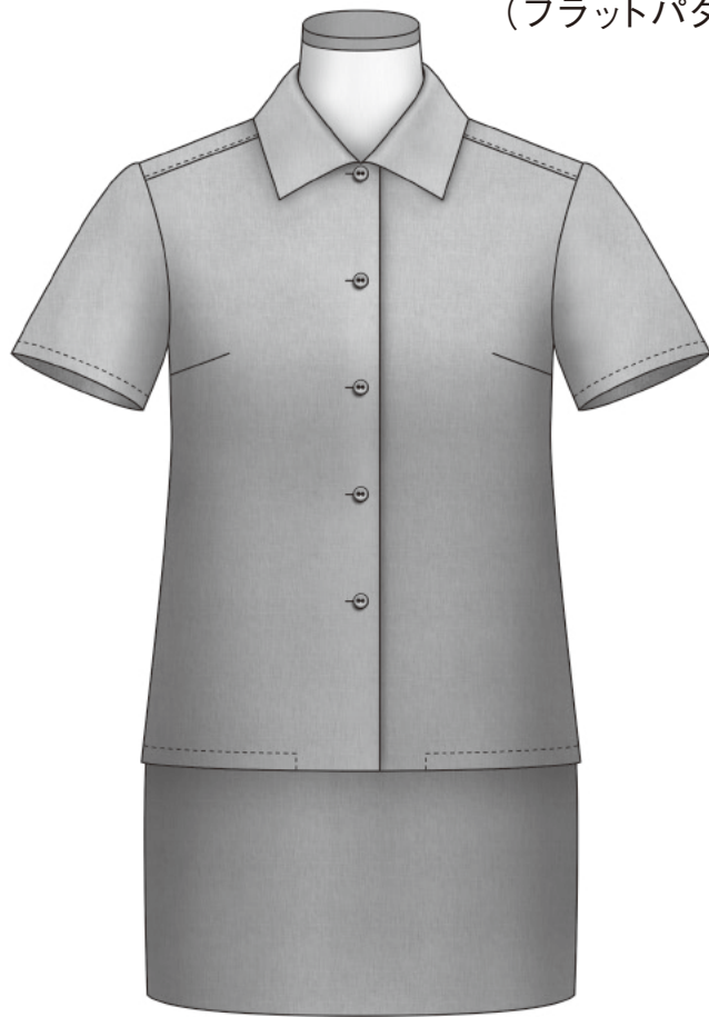
〈シーチング組み立て完成図〉