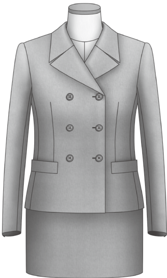
〈シーチング組み立て完成図〉

②ファーストパターン パーツの名称、地の目線、記号、合い印を記入のこと。縫い代は不要。 (パターンメイキングの場合は原型を使用した作図を添付のこと。)